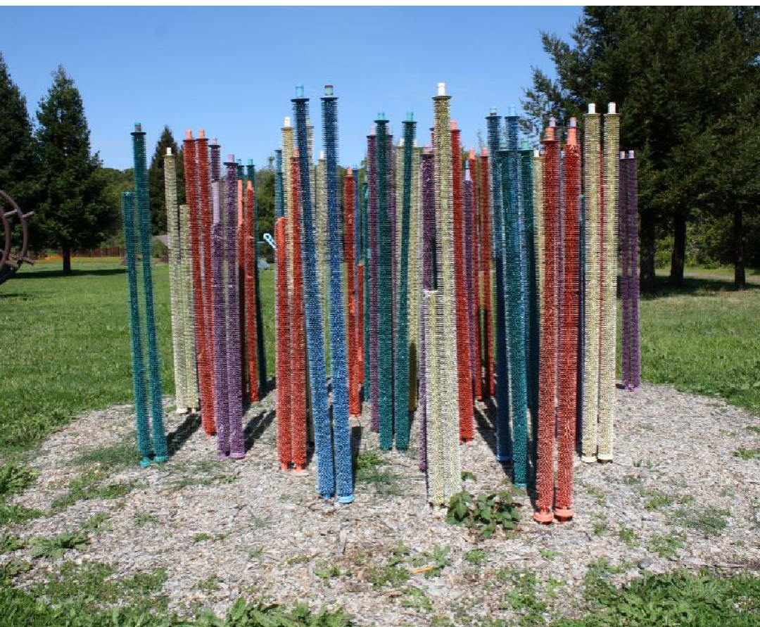
Gordon Huether Cactus Garden, 2003 Salvaged metal radiators and powder-coating