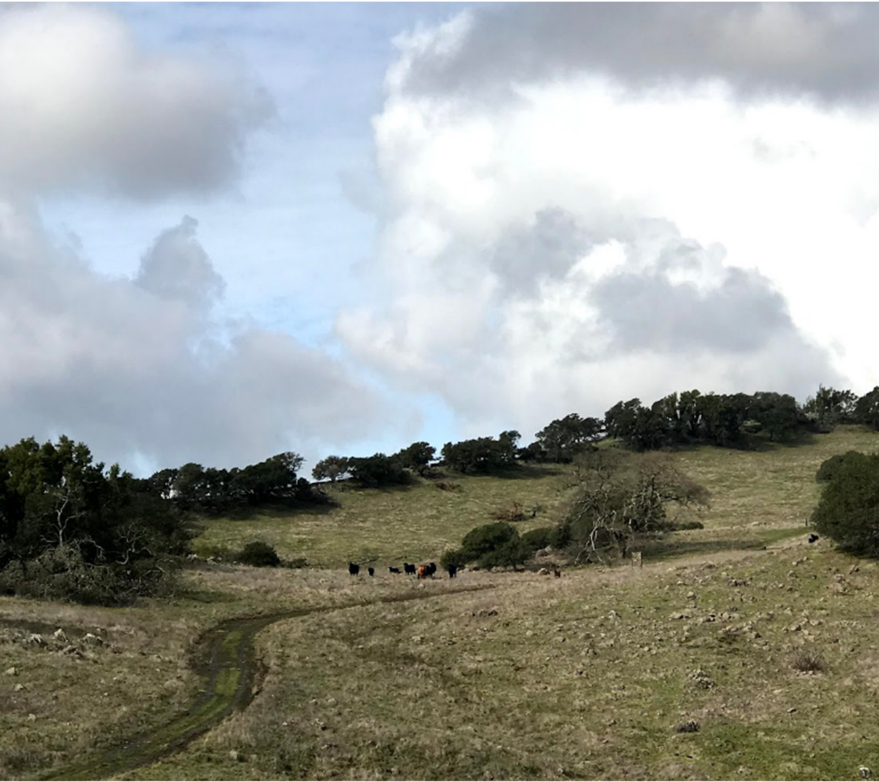
The north end of the di Rosa property, on the path up Milliken Peak.