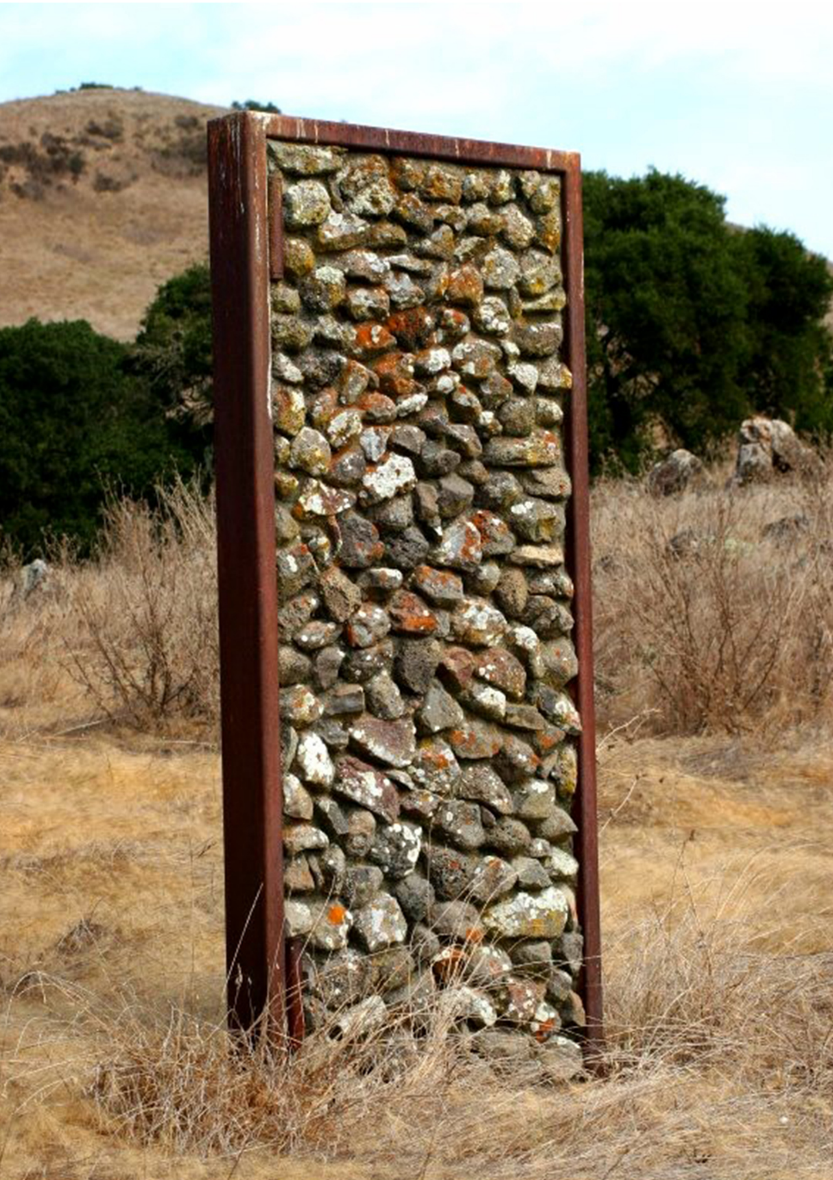
Paul Kos Doorway from the Outside to the Outside, 1970 Wood, metal, concrete, and (stone added 1986)