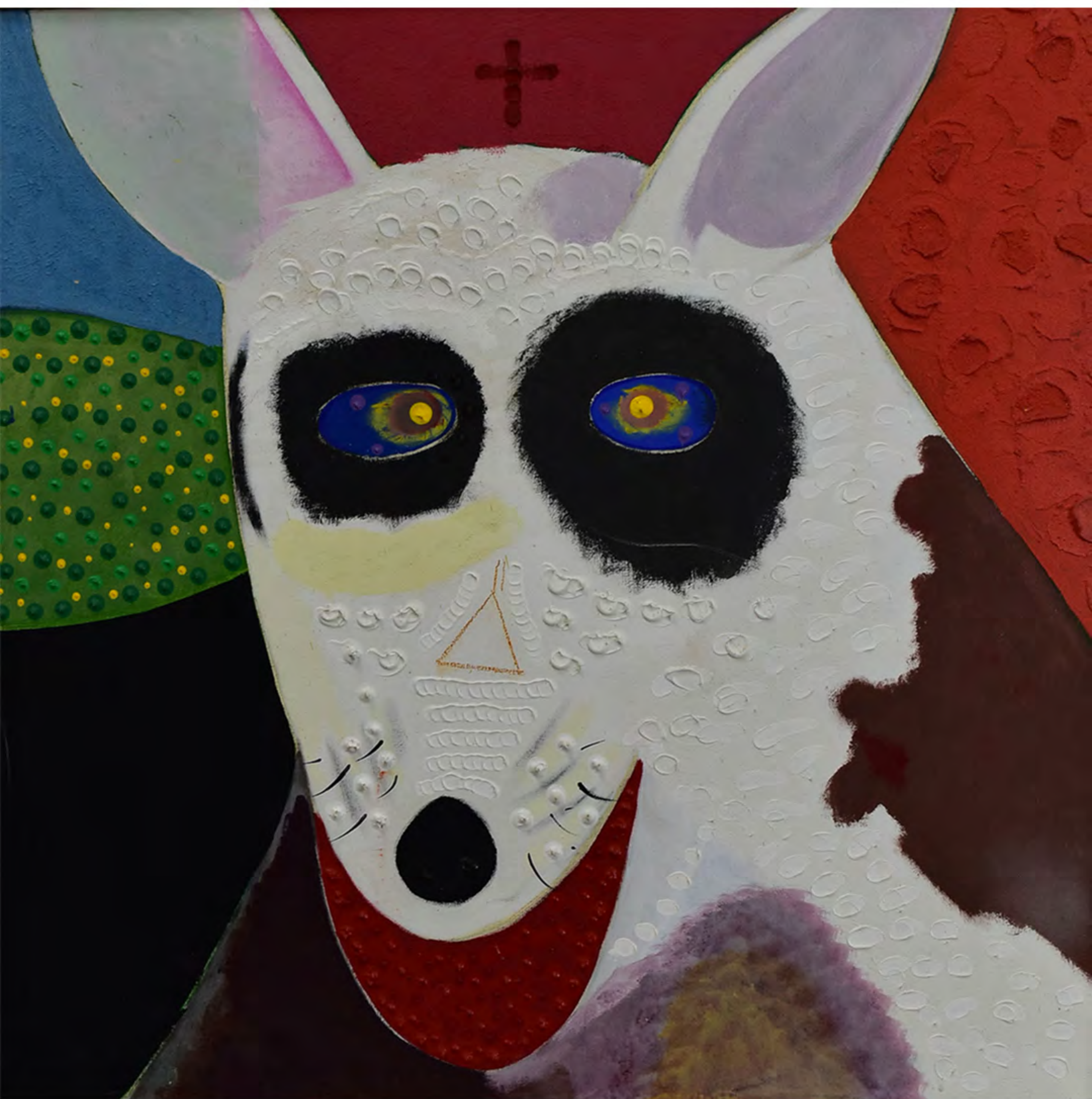
Roy De Forest, Fred, 1978