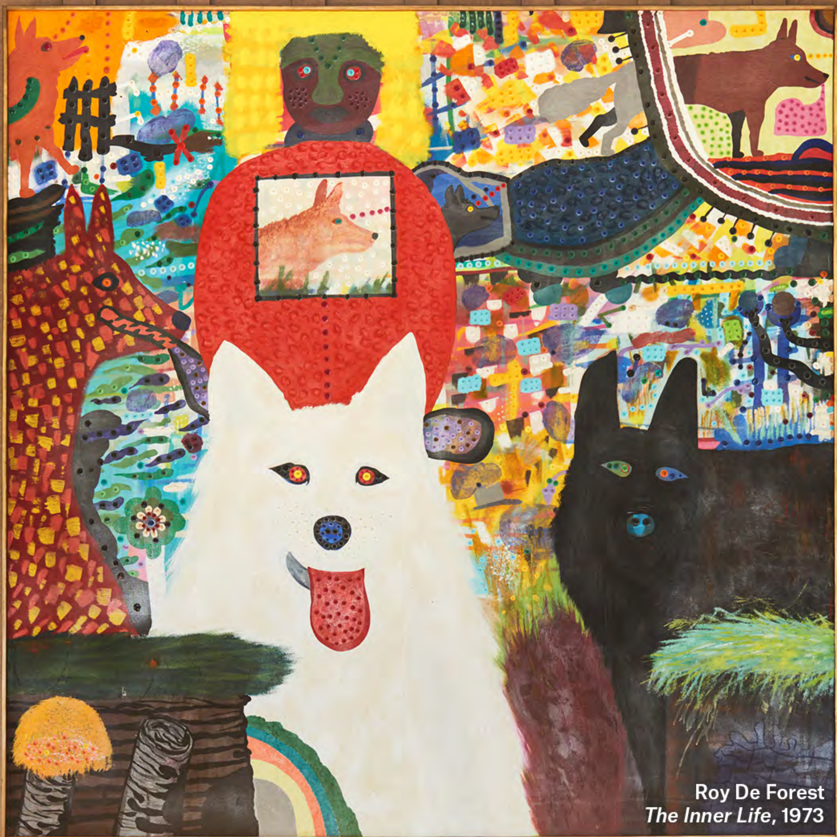
Roy De Forest The Inner Life, 1973